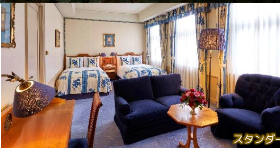
スタンダードルーム

海を庭に持つホテルヨーロッパ。アムステルダムにある100年の伝統を誇る同名ホテルを一段とグレードアップしてハウステンボスの一角に再現しました。19世紀のオランダの邸宅を思わせるインテリア、運河を望む優雅なレストランでは極上のフランス料理を堪能する贅沢も味わえます。