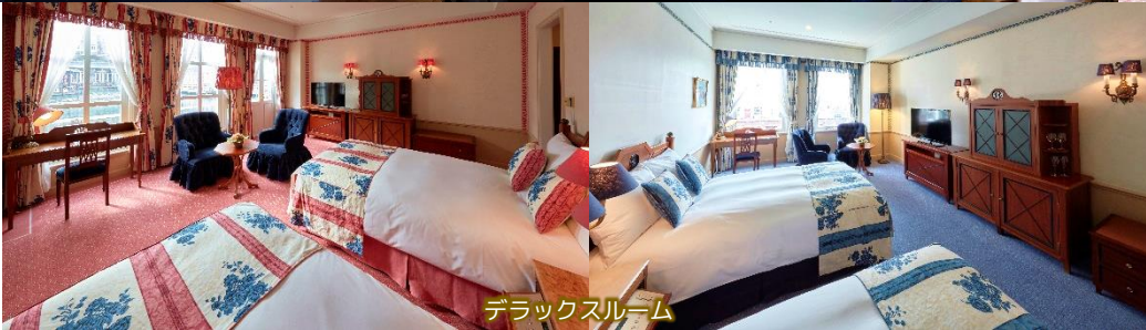
デラックスルーム

お部屋からは、ヨーロッパのような美しい街並みを望むことができます。季節や時間で変化する景色とパークを行き交う人々の賑わい。ハウステンボスの雰囲気を身近に感じていただきながらご宿泊をお楽しみください。