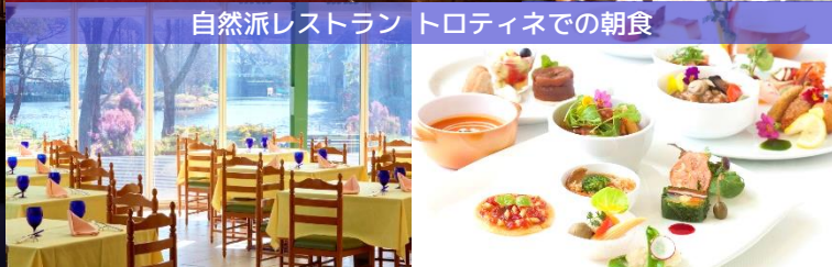
自然派レストラン トロティネでの朝食