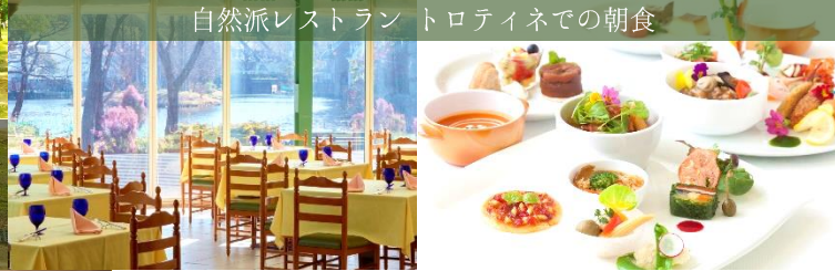
自然派レストラン トロティネでの朝食

別荘感覚のコテージで、森に囲まれたレイクサイドヴィラ。豊かな自然に囲まれた、ハウステンボスの敷地の中でも最も静かな場所。独立した2ベッドルームと、テラス付リビングの構成は家族や仲間との滞在にもぴったりです。