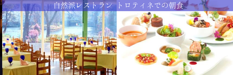
自然派レストラン トロティネでの朝食